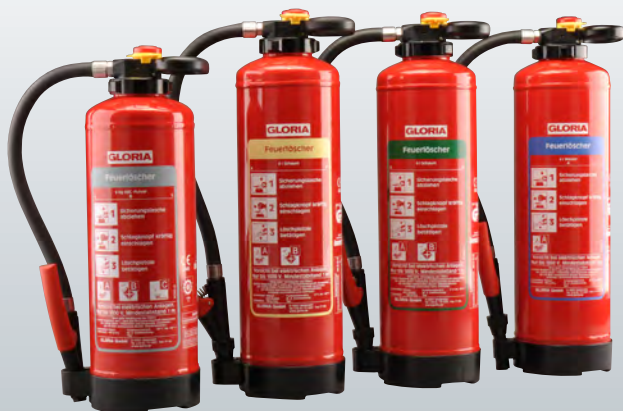
Pulver Schaum Öko-Tipp Wasser